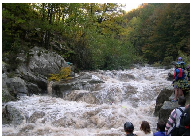
Escalier de la Peyre