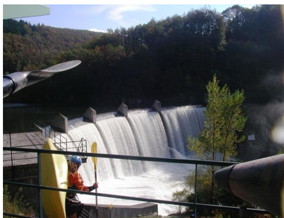
Barrage de Pontviel (départ)